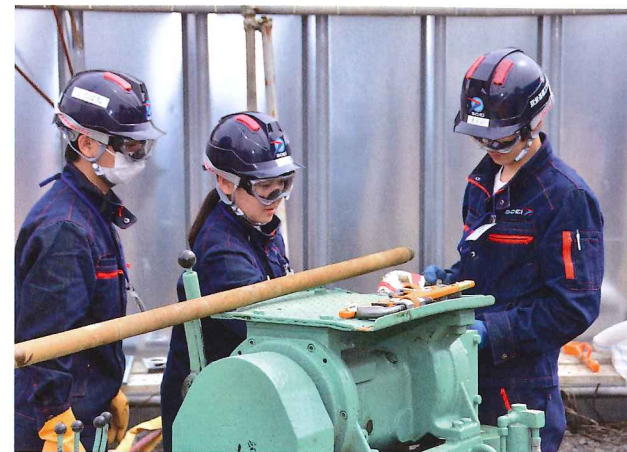
職業訓練校の風景。新しいデザインの作業服を着て実習に臨む